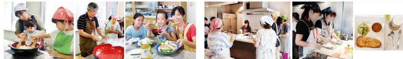
8/8 手打ち冷やしラーメン 22名 8/11 大人のパン教室ナン&キーマカレー 19名