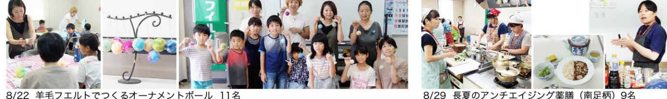
8/22 羊毛フェルトでつくるオーナメントボール 11名 8/29 長夏のアンチエイジング薬膳(南足柄) 9名