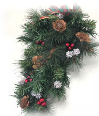
クリスマスドロップスワッグ