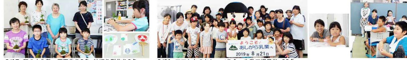
8/17 和の文化塾・苔玉作り8名 紋切り型作り3名 8/21 ママたちのおしゃべり会・牛乳工場見学 32名