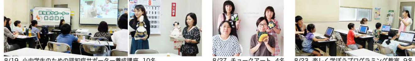
8/19 小中学生のための認知症サポーター養成講座 10名 8/27 チョークアート 4名 8/23 楽しく学ぼうプログラミング教室 9名