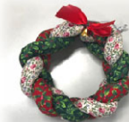
クリスマスリース

クリスマスのインテリアにぴったりな「クリスマスドロップスワッグ」と「クリスマスリース」を作ります。