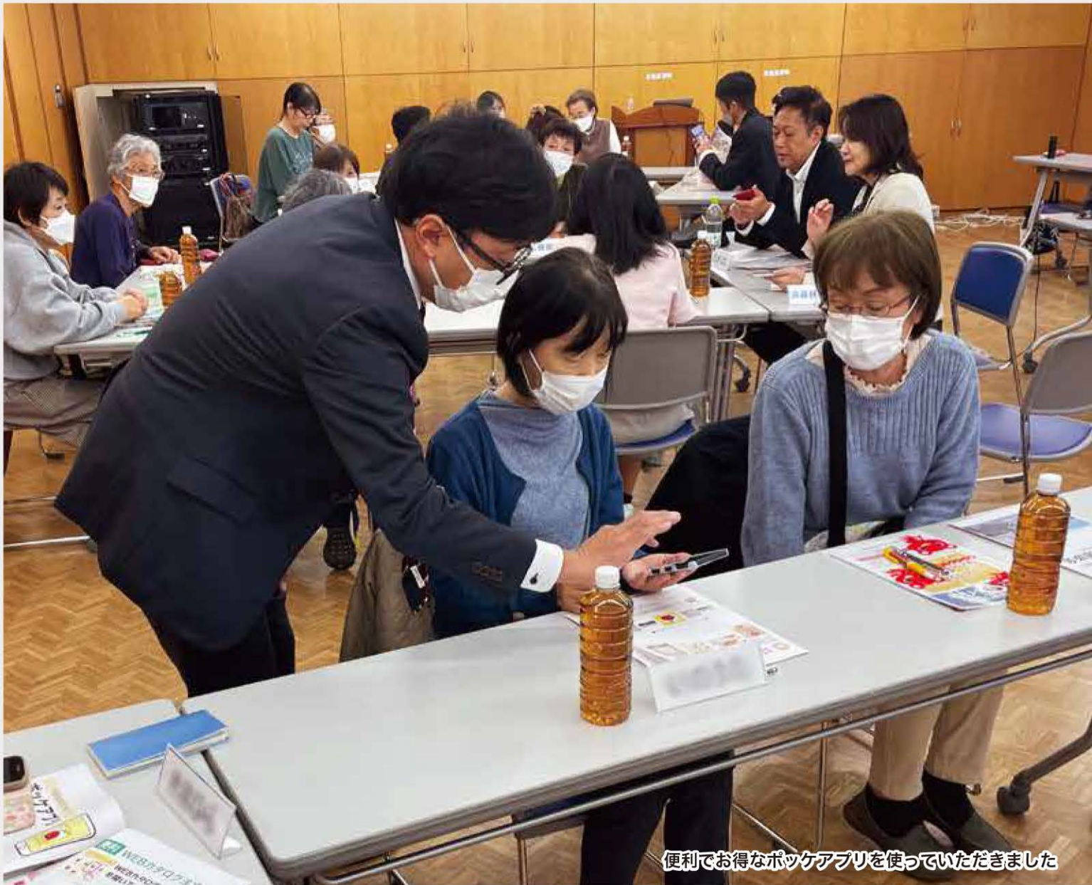
便利でお得なポケアプリを使っていたきました

NICOLIFE (ニコライフ) は富士フィルム生協が発行するマンスリーニュースレターです。富士フィルム生協は宅配事業の他に福祉・介護事業や共済事業、シニアサービス、富士フィルムヘルスケア商品販売など、組合員の皆さまの心豊かなくらしをサポートする様々なサービスを提供しています。NICOLIFEではそれぞれの最新の情報や取り組み、コープ商品の紹介、イベント案内など、組合員の皆さまのくらしに役立つ情報をご紹介します。