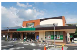
ユーコープ秦野曽屋店