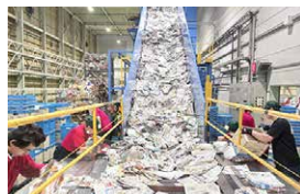
ユーコープリサイクルセンター