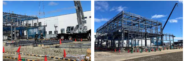
※建設中の新センター