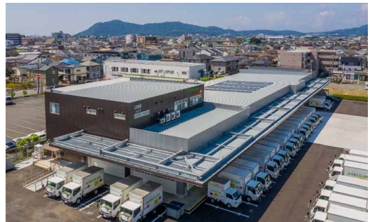
※写真は平塚センター