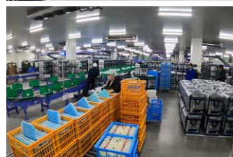
物流センター（ユーコープ静岡ベース）